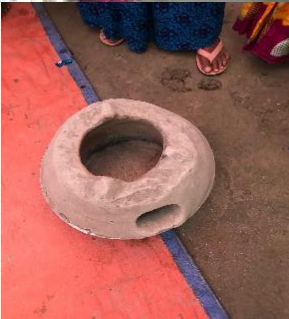
Algunas herramientas de preparación para el riesgo antes de la inundación en Kurigram....