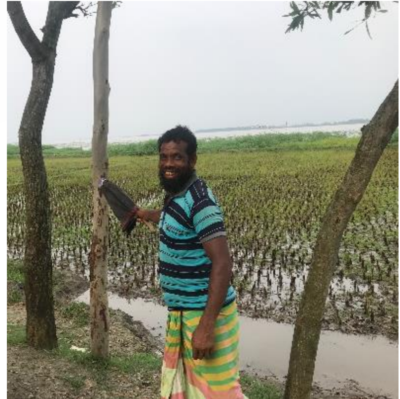
Campesino en Bangladesh distrito de (Kurigram) muestra el nivel de la última inundación (2017)